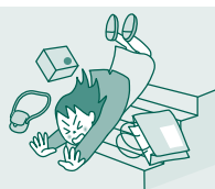
階段から 落ちてケガ