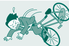
自転車で転倒して ケガ