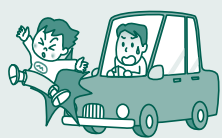
交通事故による ケガ