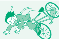
自転車で転倒して ケガ