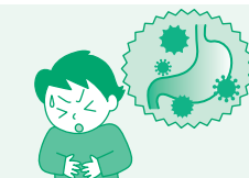
細菌性・ウイルス性 食中毒